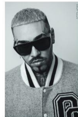
ALEX VELEA , nominalizat la categoria Best Male Artist

Anul 2020 mi-a arătat o nouă versiune a mea și m-a învățat să fii mai răbdător, mai tolerant și mai iertător. Cred că vremurile ne-au făcut pe toți puțin mai responsabili și mai atenți la ce se întâmplă în jur. Rămân optimist și aștept să trecem cu bine de această perioadă.